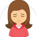
KESEJUKAN & MUNTAH CHILLS & VOMITTING