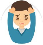
SAKIT KEPALA/ HEADACHE