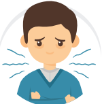
KELETIHAN MELAMPAU/ EXTREME FATIGUE