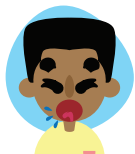
BATUK & SAKIT TEKAK/ COUGH & SORE THROAT