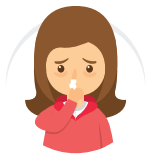
SELESEMA/ RUNNY OR STUFFY NOSE